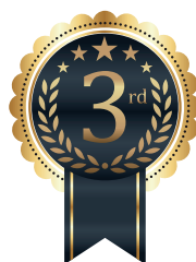
Troisième Khaled Al-Buraq